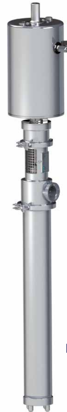
Pompa PA-AM lunga

Connessioni per le bocche di collegamento con filettatura gas cilindrica.