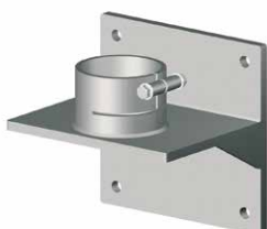
Mensole a muro per fissaggio delle pompe a parete