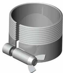
Morsetto filettato 2''