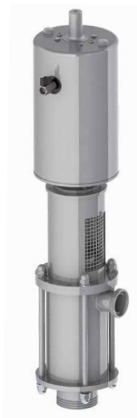
Pompa PA-AM corta